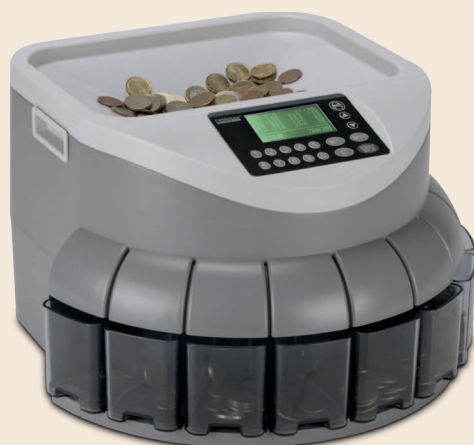
coinsorter CS 150