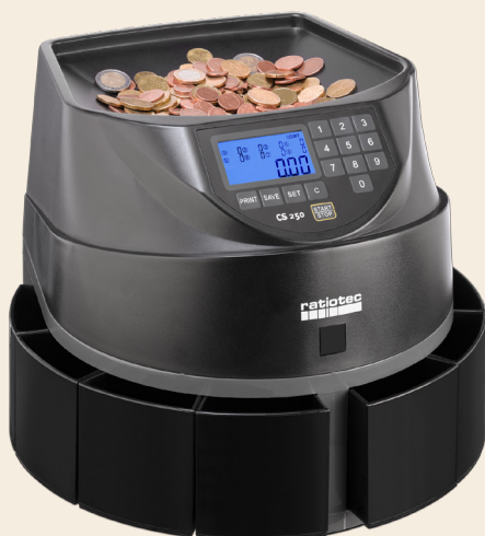
coinsorter CS 250 | CS 250 spezial

Unsere neue Münzzähl- und Sortiermaschine CS 250 | CS 250 spezial zählt schnell und zuverlässig mittlere Zählvolumen. Mit einer Geschwindigkeit von bis zu 550 Münzen pro Minute ermittelt dieses Modell schnell das exakte Zählergebnis. Über das Menü kann die Anzeige der Gesamtsumme oder der Stückzahl eingestellt sowie ein eigener Zählstopp für jede Münzsorte programmiert werden.