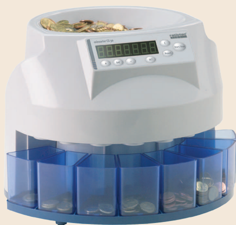
coinsorter CS 50